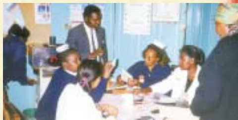
Frère A.G. distribuant de la littérature évangélique aux infirmières de l'Hôpital Général de Nyéri—Nyéri, Kenya.