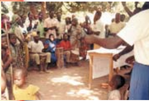
Prêcheurs dans les villages du Tchad.