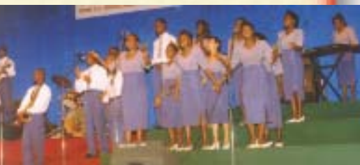
Orchestre et chœur du Pasteur K.H. faisant un joyeux tapage au nom du Seigneur!—Abidjan, Côte D'Ivoire.

qui est d'aimer le Seigneur Dieu de tout notre cœur, de toute notre âme, de tout notre esprit et de toute notre force, 88 celui-là atteindra un jour le stade ultime de ce que Dieu souhaite et veut pour nous: régner en Son nom et établir le royaume des Cieux sur la terre. Si nous régnons en Son nom ici-bas, nous règnerons pour toujours dans les Cieux. 89 L'Apocalypse 22 :5 le formule en ces termes: «La nuit ne sera plus; et ils n'auront besoin ni de la lumière d'une lampe, ni de la lumière du soleil, parce que le Seigneur Dieu les éclairera. Et ils [ceux qui ont régné sur terre pour et par le Christ] règneront aux siècles des siècles».