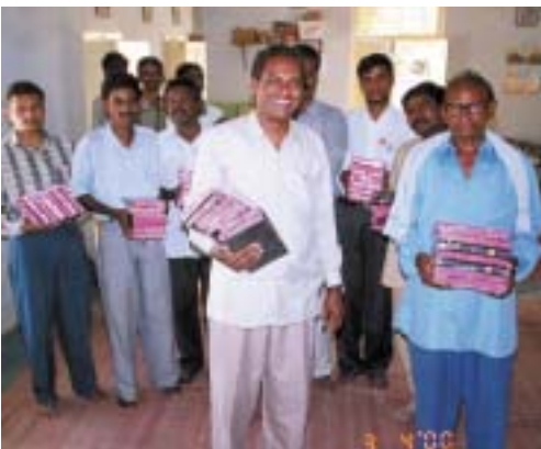
Les assistants pasteurs de l'Église Alamo Christian Ministries s'appropriant à distribuer gratuitement des Bibles.