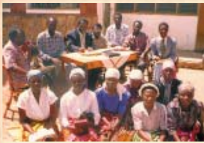
Pasteur J.S. (au centre avec un costume) avec des membres de l'Alamo Christian Ministries—Musema, Tanzanie.

Ceux qui utilisent à des fins personnelles le pouvoir accordé par Dieu au lieu de le faire servir à l'accomplissement du royaume de Dieu sur la terre, ceux-là sont semblables à Lucifer qui a usurpé l'autorité de Dieu dans l'espoir d'améliorer sa condition—tout comme Ève. 73 C'est l'œuvre de