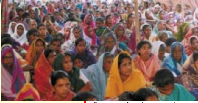
Groupe de femmes à une réunion de l'Église Alamo Christian Ministries—Inde.