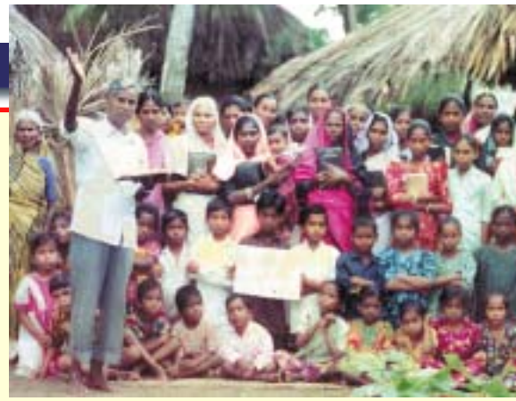
Le Pasteur P.S.R. de l'Église villageoise Alamo

Pour notre part, nous sommes certains que