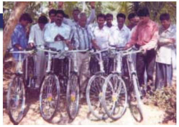
Frère J.E. avec des évangélistes venant de recevoir de nouveaux vélos de l'Église du Pasteur Alamo.

musulmanes prier, chanter et marcher avec une Bible entre les mains.