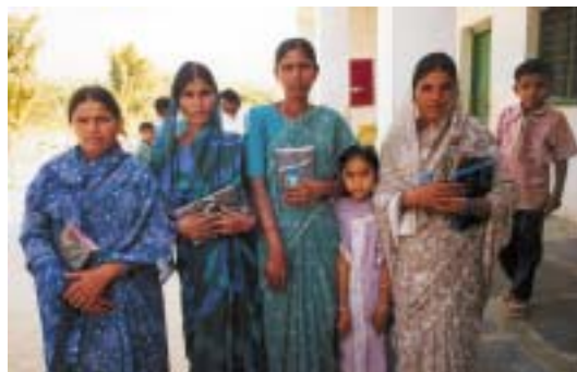
Chargées de Bible lors d'une conférence de pasteurs.