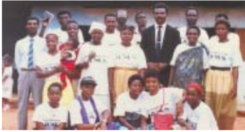
Pasteur Associé B.A. (dans le costume sombre) avec quelques choristes—Cameroun.