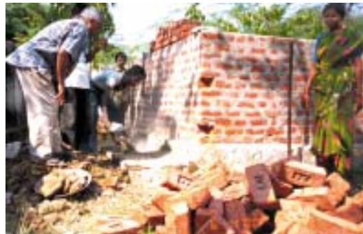
Le Frère J.E. observant la construction d'un nouveau fond baptismal.