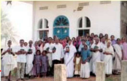
Église Alamo Christian Ministries—Amalapuram, Inde.