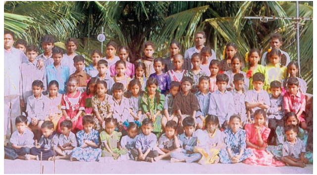
כומר המשנה של כנסיות אלאמו הנוצריות, ג'יי. אר. מנהל מפגש התעוררות הקשור לבשורה ברה'ג'שמומגרי, הודו.