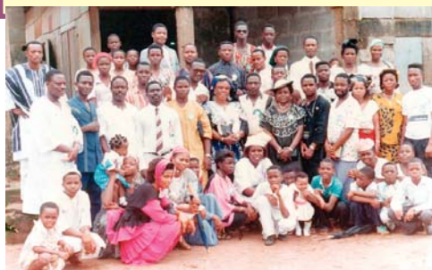
מחלקי ספרות וחברי קהילה של כנסיות אלאמו הנוצריות, כומר המשנה וי. או. - בנין סיטי, ניגריה

הוא חייב להופיע במועד קבוע (בראשית מ"ט, 10 דניאל ט', 24-25 עם איגרת אל הגלטיים ד', 4) להיוולד לבתולה (ישעיה ז', 14 עם הבשורה על-פי מתי א', 18-23 וכן הבשורה על-פי לוקס א', 27, 35), בבית לחם אשר ביהודה (מיכה ה', 1 עם