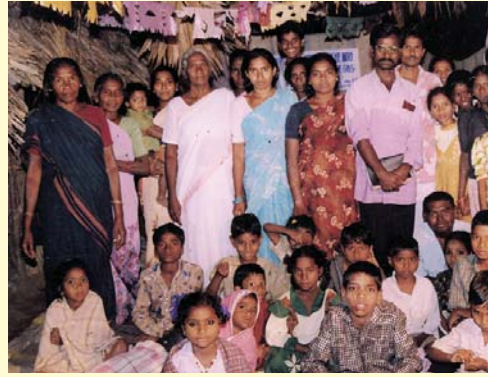
כומר המשנה ו.ו. של הכנסיה הנוצרית אלמו, עם חלק מהקהילה שלו. - רנגמטה מנדל, הודו.

מחלקים וחברים של הכנסיה הנוצרית אלמו מתכוננים לחלק את הספרות הזוכה בשמות ואת ספרי המשיח של הכומר אלמו בהידרברג, הודו.