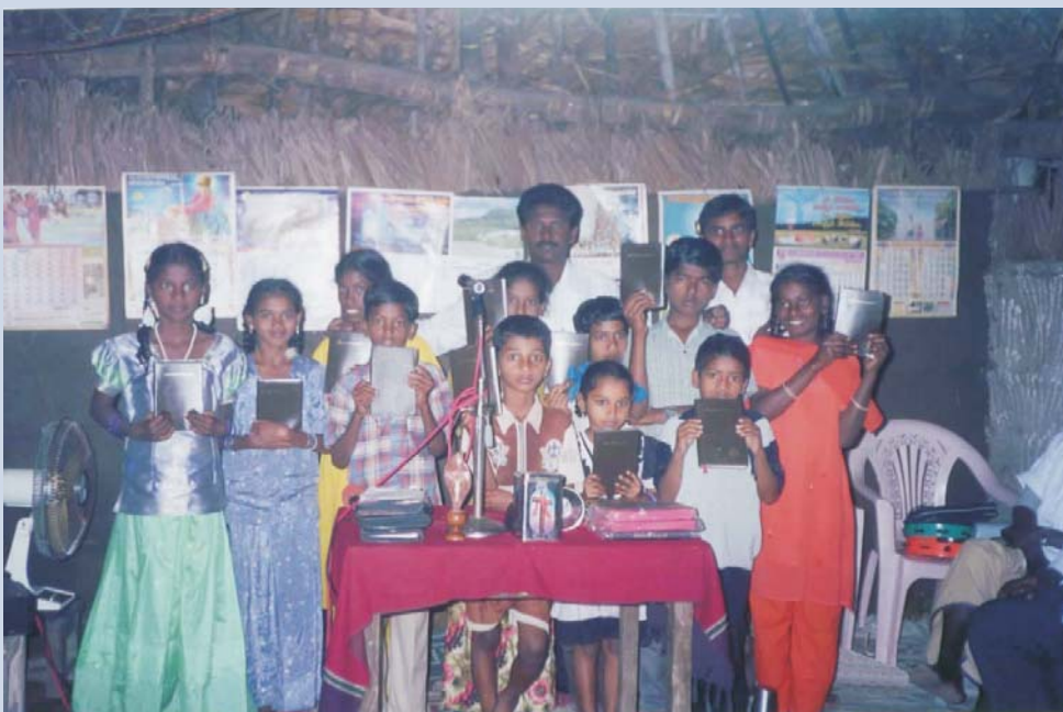
חברי הכנסייה הנוצרית של טוני אלאמו באנדהרה פראדש שבהודו, עם עותקים מספרו של הכומר, "המשיח".