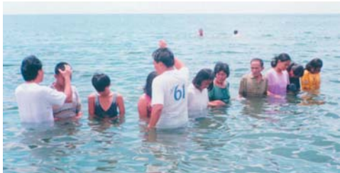
Bautizando nuevos convertidos – Ministerios Cristianos Alamo – las Filipinas

Ore por mí y yo estaré orando por usted – por todos aquellos que creen en Jesucristo y que enfrentan los mismos conflictos. Cuando una persona acepta a Jesucristo como su Salvador personal, hay una batalla feroz entre el Espíritu Santo y la carne. Yo soy un guerrero para el Señor Jesucristo en las calles de Caracas donde hay drogas, licor, delincuencia, confiscación de propiedades, donde los padres están contra sus hijos y los hijos están contra los padres, y donde las familias son destruidas por la homosexualidad. Que Dios nos ayude a alcanzar a esta gente con Su Palabra para que a nadie le falten los dones de Dios. Hermanos, si es posible, envíenme Los Agentes Secretos de Satán , El Sábado del Verdadero Creyente , y el librete titulado El Mesías . Que Dios en Jesucristo continúe derramando bendiciones poderosas sobre usted para que Él, que es poderoso, pueda guardarlo de caída y lo pueda presentar sin mancha con gran gloria y gozo. Para el único Dios nuestro Salvador sea la gloria, la majestad, potentado ahora y para siempre. Amén. Y el mismo Señor de paz le dará paz de toda manera. Que la gracia de Dios esté con todos ustedes. Amén.