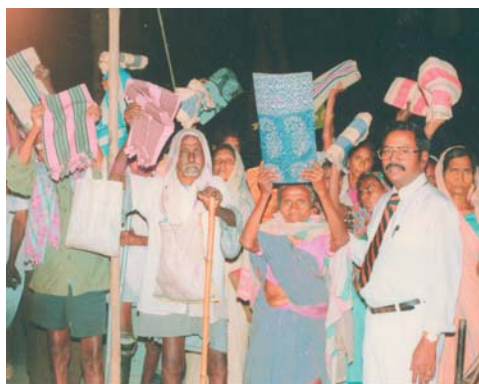
Distribución de mantas y sáris a los leprosos y las viudas pobres – D.R.

Suyo en este servicio evangélico, C.S. Kovvur Mandalam, la India