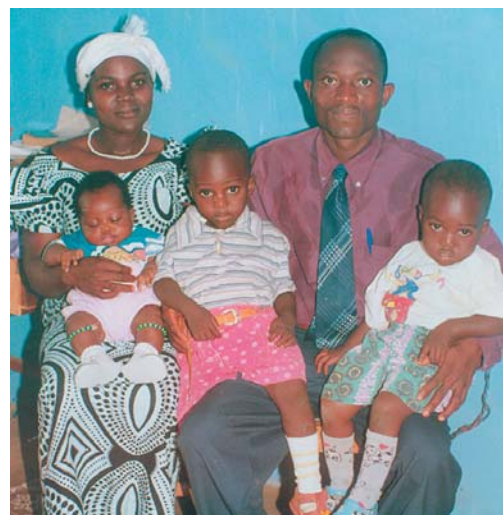
El Hermano A.I. con su esposa e hijos