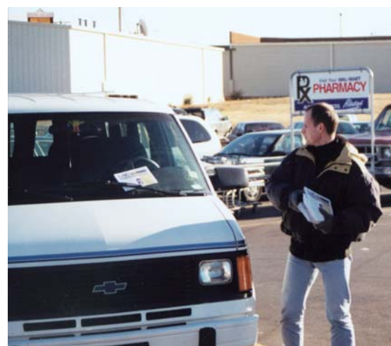
El hermano J.F. de Slovenia distribuye la literatura evangélica de Alamo en Little Rock, Arkansas

no tienen ninguna parte en Él. 24 ¿Crees que estás unido con el Señor en Su muerte y en Su resurrección? Ser unido en Su muerte y Su resurrección es experimentar todo lo que Él ha experimentado. 25