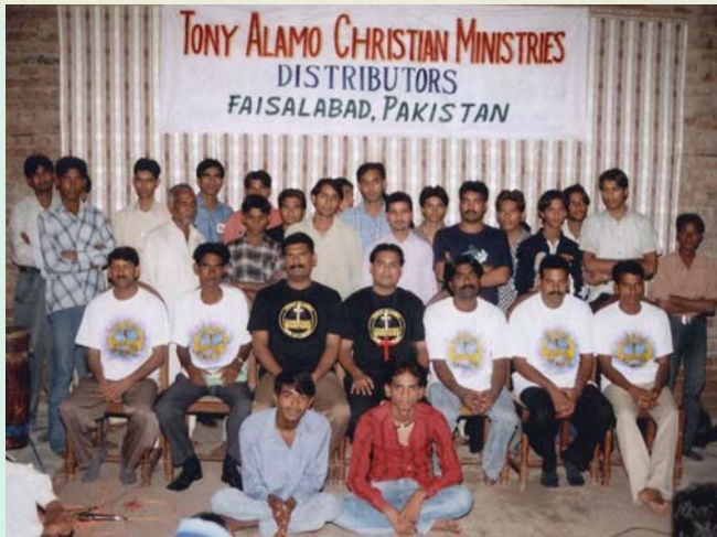
Distribuidores de los Ministerios Cristianos de Tony Alamo—Faisalabad, Paquistán

Le pido que me dé la oportunidad de visitar su ministerio. Tengo el deseo de encontrarme con usted, y deseo conocer a los miembros de su iglesia, y coro. Con esto, también deseo repartir su literatura en otros países para que