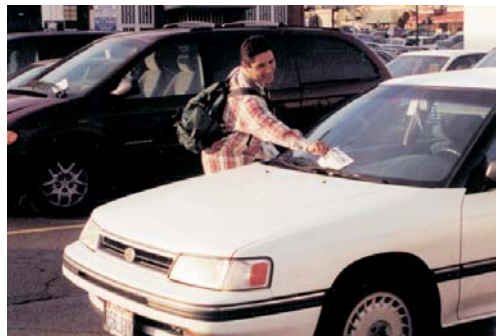
Gli scritti del Pastore Alamo, che trasformano la vita, distribuiti a Spokane, Washington.