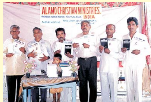
I membri della congregazione dei Ministeri Cristiani Alamo si apprestano a distribuire gli opuscoli che avvinocono l'anima e i libri del Messia, a Hyderabad, India.