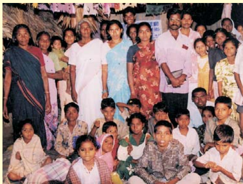
V.Y., il Pastore Associato dei Ministeri Cristiani Alamo, con alcuni membri della sua congregazione. – Rangampeta Mandal, India