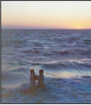
۱۹۷۱ کی تصاویر