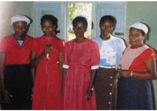
שירת מזמורים באיי הודו המערבית

ישוע אמר לתלמידיו: "מי שרוצה לבוא אחרי... ילך אחרי" (מרקוס ח', 34). 154 הם מיד עזבו את העבודה בה היו עסוקים והלכו אחריו. 155 כך זה חייב להיות היום. אלוהים קורא לכל אל תוך גופו, שם יוכל אלוהים לשכון ולפעול, הן כדי שיוכלו להיושע והן שלא יולכו לגיהנום. 156 הוא רוצה