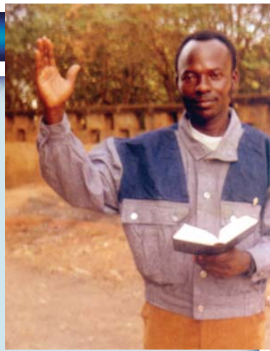
האח ג'יי. אי. - וויאווסו, אפריקה