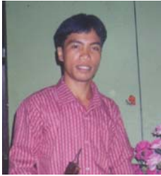
האח ג'י. סי. - איִנְקָבֶן, הפיליפינים

את פרי רוח הקודש. יש לי אחות נוצריה בפֶּנְס, טקסס, וכל האחים מחבקים אותה ואומרים לה שישוע אוהב אותה. מאז ומתמיד היא היתה פעילה מאוד והם מזמינים אותה למסיבותיהם ולאסיפות קהילתיות, רק כדי שתעשה את עבודת הניקיון לאחר-מכן. כל אלה שאומרים כי הם אוהבים אותה, הם גם אלה המנצלים אותה ביותר. היא אלמנה ואני עד לכך שמנתקים לה את החשמל מדי פעם כי אין לה מספיק כסף. יש לה נכד שננטש על-ידי בתה, והיא מטפלת בו. היא אינה יכולה להרשות לעצמה אפילו לשלם עבור טלפון. כשאני רואה את כל אשר קורה לה, אני אומר שאם אי-פעם אתחבר לכןסייה כלשהי, היא חייבת להיות כמו כנסיית אלואמו הנוצרית, אשר עובדת את האלוהים וגם מטפלת בנזקקים. תפילתי היא שאלוהים ימשיך לברך אותך ואת כנסייתך מפני שבאמצעותך השתנו חיייהם של אנשים רבים. תודה לך ולעולם לא אשכחך. היום קיבלתי מכתב מהכומר אלואמו. תודה על שהצעת לעזור לי. תודה לך על הזמן שהקדשת לי ולמשפחתי.