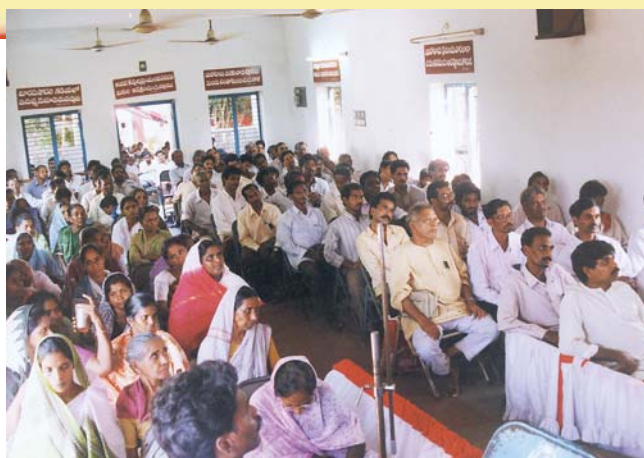
מפגש כמרים - אמלפורם, הודו