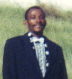
האח ג'י. אָף. - גַּנְדָּה, איי הודו המערבית