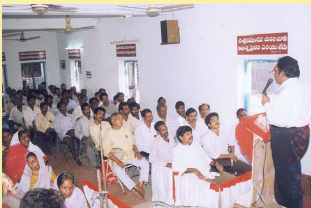
הכומר סי. אל. מטיף בכנסיית אלאמו הנוצרית - אמלפורם, הודו

קיבלתי את מכתבך, חומר הקריאה והעלון העולמי האהובים ואני מודה לך עבורם מקרב לבי. קראתי אותם ומצאתי שהם בעלי ערך רב עבורי ועבור נוצרים אחרים. קריאת הספרות שלך ממלאה אותנו ברוח הקודש. השבח לאדוני. אמן. קיבלתי את חומר הקריאה הבא: "צרות", "תודות", "משוכנע", "סוכניו החשאיים של השטן", ורבים אחרים. אנו מתפללים לאדוננו שישפיע עליך את מיטב ברכתיו עבור הספרות הנפלאה הזאת. אנו מתחזקים רוחנית מקריאתה. אנו מתפללים גם שעבודתך תתרחב לכל עבר. צוות של עשרים וחמישה מטיפים, כולל אותי, מטיפים בכפרים מבית לבית, נפגשים עם כל אדם ואדם, עורכים אסיפות רחוב, מכנסים מפגשי תפילה, ומפיצים ספרות בשורה. כל זאת כמסע הטפה. אנו עושים נפשות לתהילתו של אדוננו.