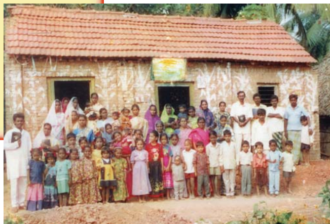
הכומר אס. סי. עם מאמינים בכנסייה - אינונקיימפטה, הודו