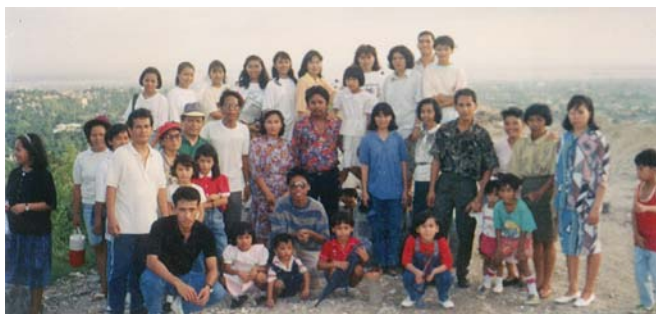
הכומר פי. איי. עם חלק מקהילתו - סבו סיטי, הפיליפינים