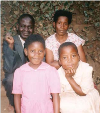
הכומר אף. אן. עם מספר בני משפחתו - מלאוי, אפריקה