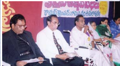
נואמים אורחים ישובים על הבמה.