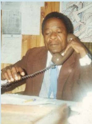
האח אר. אס. - מלאווי