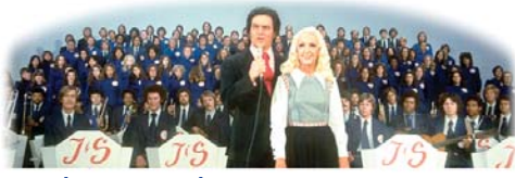
בקר באתר האינטרנט של כנסיית אלמו