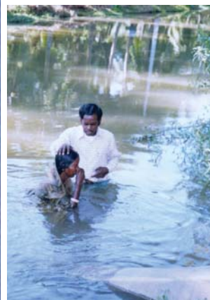
הטבלה בנהר על-ידי הכומר קיי. פי. - פודורו, הודו