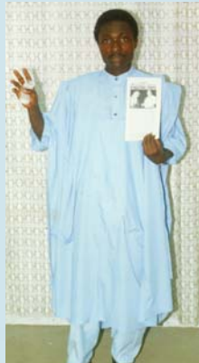
האח ג'יי. איי. - גאנה