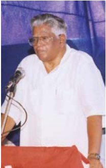
שר לשעבר של ממשלת אנדרה פרדש נוּאם בוועידה