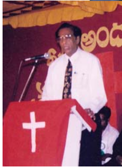
הכומר פי. קיי, נשיא האיחוד הנוצרי הכללי-הודי, מעביר את המסר בוועידה הארצית הראשונה