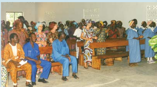
קהילת כנסיית אלמו הנוצרית עובדת את אדוני - אנוקום, טוגו, אפריקה