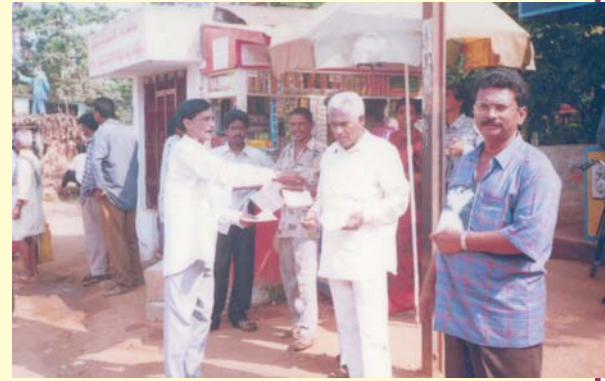
מפיצים את הספרות של הכומר אלואמו ברחבי הידרבד, הודו.

הענקתי להם את רשותי להדפיס כל חלק או את כל הספרות שלי, כמו גם מסרים מוקלטים. - הכומר אלואמו