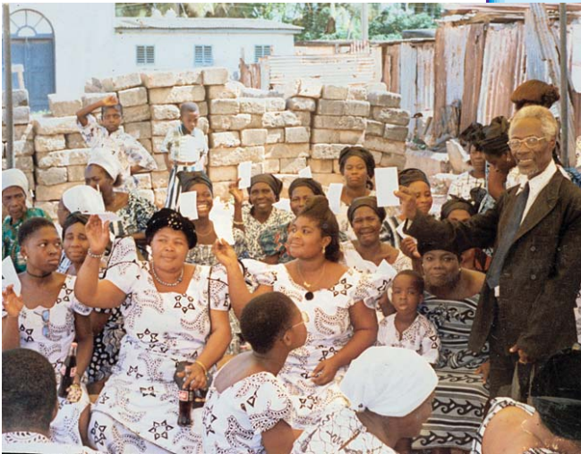
כומר המשנה של כנסיות אלאמו הנוצריות אי. או. עם זמרי גוספל ומחלקי ספרות ומסרים מוקלטים של הכומר אלאמו - סולט פונד, גאנה, מערב אפריקה