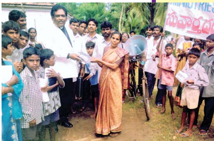
האח ס.י. אל. מטיף ומחלק את כתי הכומר אלאמו בכפרים שבסביבת אמאלאמפורם, הודו.