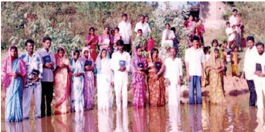
טבילה של מומרים חדשים בכפר ליד הידראבאד, הודו, על-די כנסיות אלאמו הנוצריות.