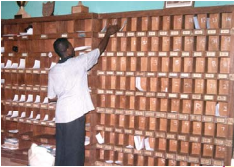
כומר המשנה של כנסיית אלֶאמו הנוצרית, איי. או. מחלק את ספרות הכומר אלֶאמו באוניברסיטת גאנה.