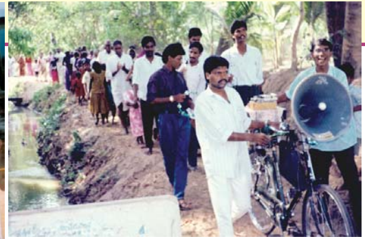
מפיצי ספרות כנסיות אלאמו הנוצריות עם הכומר בי. גיי. מגיעים לאזורים כפריים מרוחקים. - קאטרניקומה, הודו