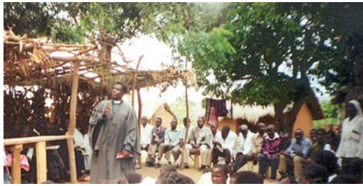
סדר תפילה על-ידי עוזר הכומר אר. סי. מכנסיית אלאמו הנוצרית בה מטיף הכומר איי. אס. - מויומבה, מאלאוי