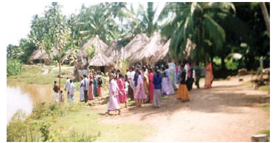
טבילה בנהר המתנהלת על-ידי קהילת הכנסייה הנוצרית אלאמו בכפר קרוב להידראבאד, אנדרה פראדש, הודו.

הכומר טוני אלאמו היקר, התחלתי לקבל את עלוניך בדואר ורצייתי להודות לך כל כך. אני נהנית לקרוא אותם, והם מקרבים אותי לאלוהים. ראיתי את אשתך, סוזן, בטלוויזיה. היא היתה אדם נהדר ומסורה לאלוהים. אנא התפלל עבורי והמשך לשלוח לי את העלונים. תודה לך, ג'יי. ג'יי. ואן בירון, ארקנסו