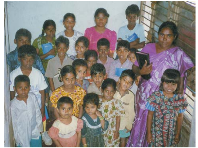
La escuela dominical del Pastor N.R. – Amalapuram, la India