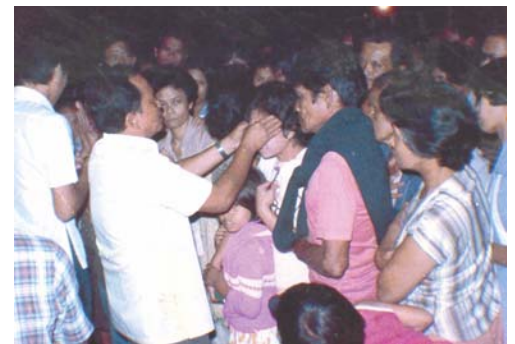
Pastor F.M. orando sobre los enfermos – las Filipinas