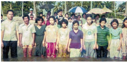
Pastor E.G. (a la izquierda) bautizando en las Filipinas