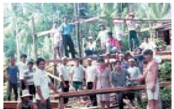
Miembros de la Congregación construyendo una pastorela nueva – las Filipinas