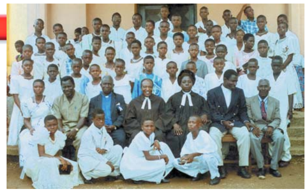
Pastor A.K. adjunto a los Ministerios Cristianos Alamo con ministros adjuntos y miembros de la congregación nuevamente bautizados – Región de Volta, Ghana

Me entusiasmé mucho el 20 de octubre del año 2000 cuando recibí su paquete conteniendo literatura evangélica. Le pasé la literatura que usted me envió a mi familia, y de hecho, casi todos se han arrepentido totalmente. Les entregué la literatura el mismo día en que recibí su carta, y el día siguiente, me contaron que habían recibido a Cristo como su Salvador personal. Por favor, espero que pueda enviarme más literatura evangélica para distribuirla a mis colegas y los de mi pueblo, incluyendo los