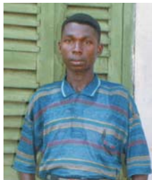
Hermano E.S. – Akroso, Ghana