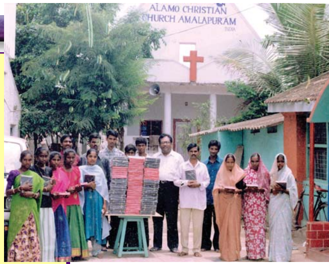
Distribuidores de los Ministerios Cristianos Alamo con Biblias para la distribución- Amalapuram, la India.

T.M. Macharamattla, la India Cristo vino a la tierra a salvar almas para que puedan obtener vida eterna y