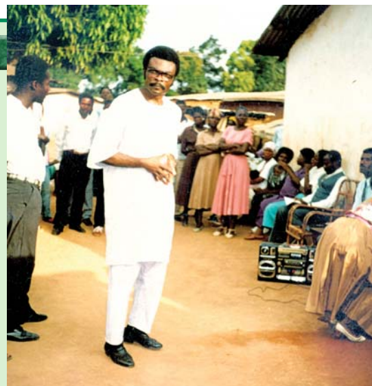
Pastor adjunto B.A. de los Ministerios Cristianos Alamo testificando en las aldeas - Camerún, África

Pastor, fui bautizado en la iglesia católica hace ocho años, pero verdaderamente nunca había invitado a Jesucristo en mi vida hasta julio del año 2000 cuando comencé adorando con la iglesia en la escuela. Pastor, recientemente he sufrido varios problemas con mi salud, y he sobrevivido por la gracia de Dios. Ahora realmente deseo seguir a Dios y hacer Su obra con toda mi vida porque si Dios hubiera tomado en cuenta mi pasado, yo no estuviera vivo hoy. Tengo un pasado muy malo, habiendo vivido en el alcohol, fumando y en la fornicación, pero le doy gracias a Dios por guardarme hasta este día, y creo que Dios tiene un plan para mí. Pastor, de acuerdo al boletín que leí, me doy cuenta que puedo aprender mucho de usted leyendo su literatura escritural. Pastor, si es la voluntad de Dios, por favor