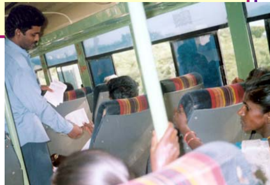
El Pastor P.P. distribuyendo la literatura del Pastor Alamo, traducida al telugu. - Andhra Pradesh, la India