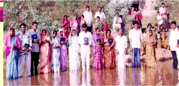
Bautismo de nuevos convertidos de los Ministerios Cristianos Alamo en una aldea cerca de Hyderabad la India

Siervo de Cristo, Pastor V.V.R. Hyderabad, A.P., la India