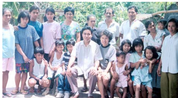
Pastor adjunto a los Ministerios Cristianos Alamo, C.A. con su familia y miembros de la congregación.- Camarines Del Sur, las Filipinas

para que Dios por nosotros pueda reprendre “al mundo de pecado, de justicia y de juicio” (Juan 16:8). Tenemos que creer que los Cristianos son los templos de Dios, Su mansión, Su casa. 49 Él está viviendo en mí y está obrando en mí, como hizo en Cristo, ambos para el querer como el hacer, por Su buena voluntad.