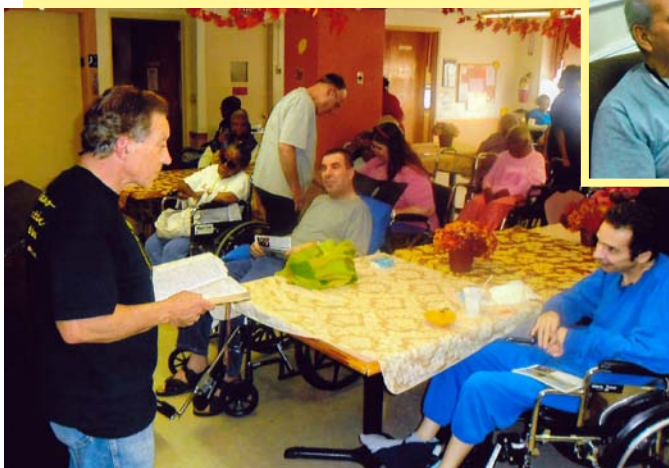
Hermanos y hermanas del Ministerio de Alamo ministrándole a los ancianos internos en los hogares de ancianos