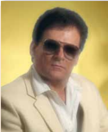
Пастор Тоні Аламо Фото 1986 року